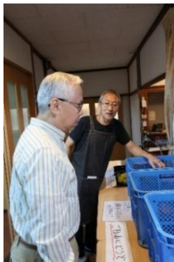
(寄せられた柿やサツマイモほか)